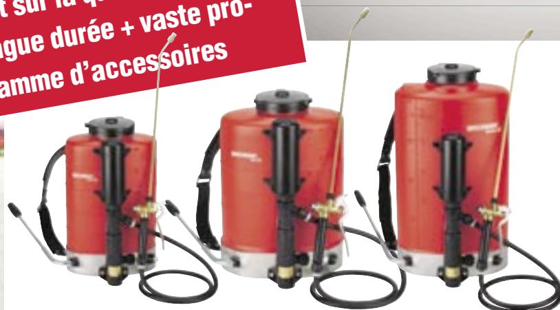
Flox 10 l